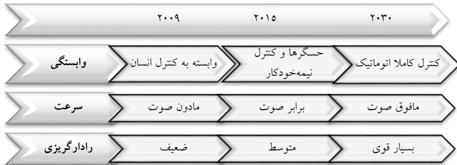
شکل شماره ۱. مقایسه و برآورد پیشرفت مهم‌ترین آیتم‌های مطرح در پهپادها