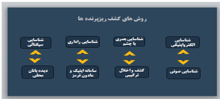
شکل شماره ۶. روش‌های کشف ریز پرنده‌ها

استفاده از پهپادها در مقایسه با هواپیماهای سرنشین‌دار نیز آسان‌تر، ارزان‌تر و کم‌خطرتر است و اگر نیروهای مسلح هر کشوری توجه اساسی به مقوله مقابله با پهپادها نداشته و برنامه‌های لازم در این رابطه نداشته باشد، در درگیری‌های آینده به‌سختی شکست خواهد خورد. روش‌های مقابله و انهدام به شرح شکل (۶ و ۷) ارائه گردیده است.