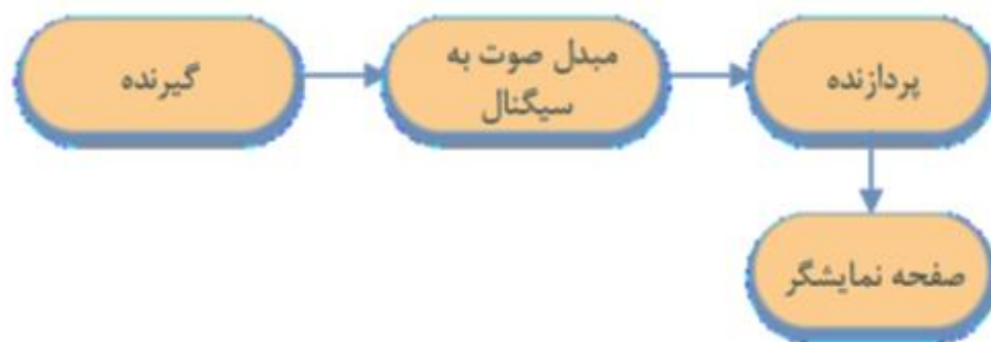
شکل شماره ۲. بلوک دیاگرام کشف و شناسایی