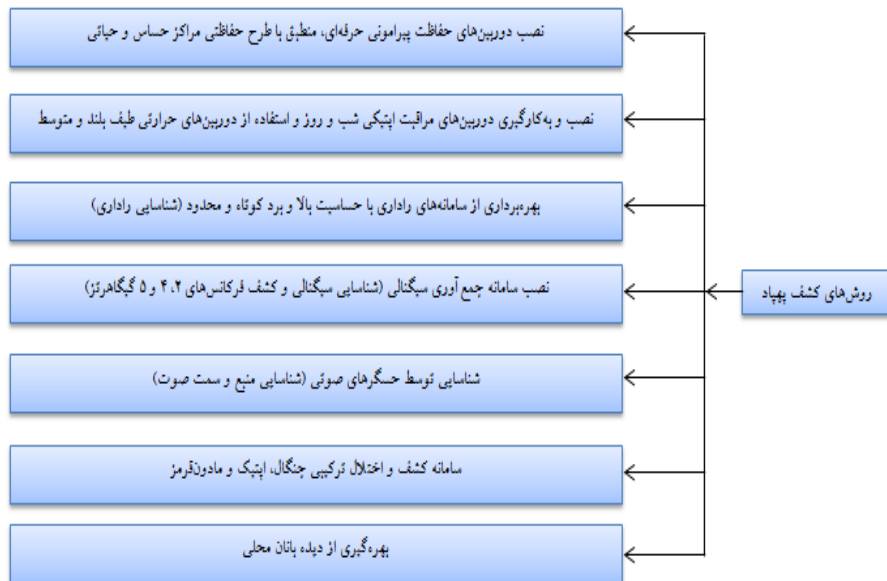
شکل شماره ۳. روش‌های کشف ریزپرنده‌ها

با توجه به نوع، اندازه و مأموریت‌های ریزپرنده‌ها، راهکارها و ابزارهای مختلفی برای مقابله با آن‌ها وجود دارد. روش‌های کشف به شرح شکل (۲) ارائه گردیده است (خرم‌فعال، ۱۳۹۹: ۱۰۶)