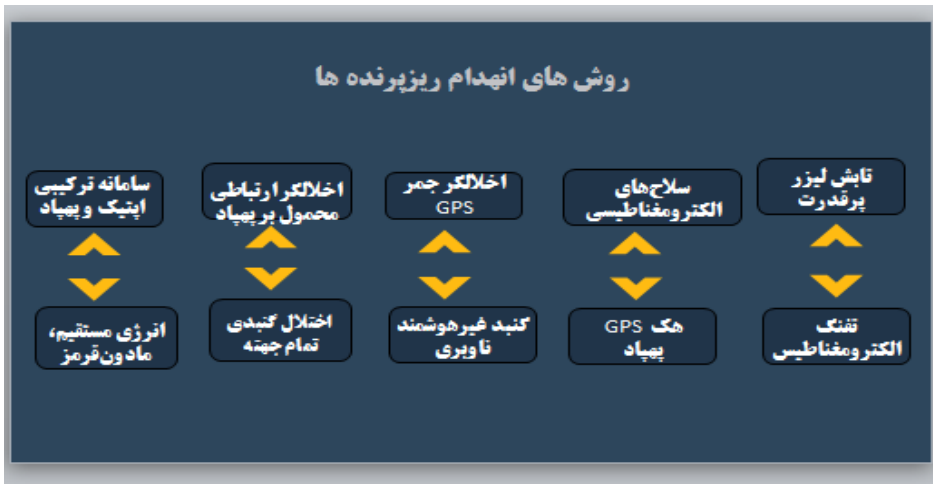
شکل شماره ۷. روش‌های مقابله و انهدام ریز پرنده‌ها

روش‌های مقابله و انهدام به شرح شکل (۷) ارائه گردیده است.